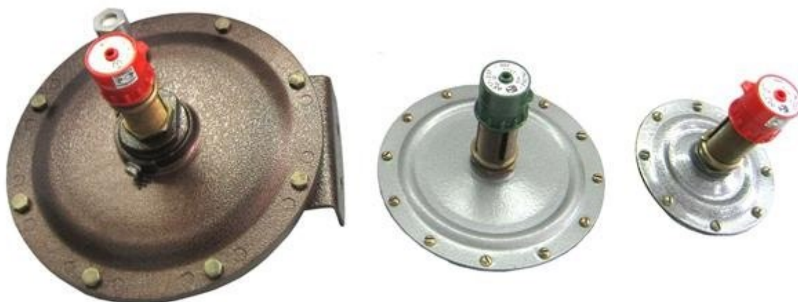
Датчики-реле давления ДЕ57-2, 5ПН, ДЕ57-2, 5Т, ДЕ57-6Т

Алматы (7273)495-231 Ангарск (3955)60-70-56 Архангельск (8182)63-90-72 Астрахань (8512)99-46-04 Барнаул (3852)73-04-60 Белгород (4722)40-23-64 Благовещенск (4162)22-76-07 Брянск (4832)59-03-52 Владивосток (423)249-28-31 Владикавказ (8672)28-90-48 Владимир (4922)49-43-18 Волгоград (844)278-03-48 Вологда (8172)26-41-59 Воронеж (473)204-51-73 Екатеринбург (343)384-55-89