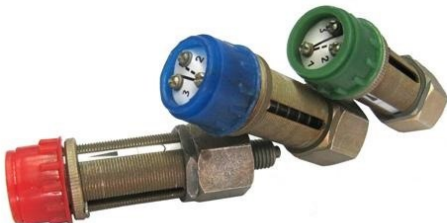
Датчик-реле давления ДЕ57-200