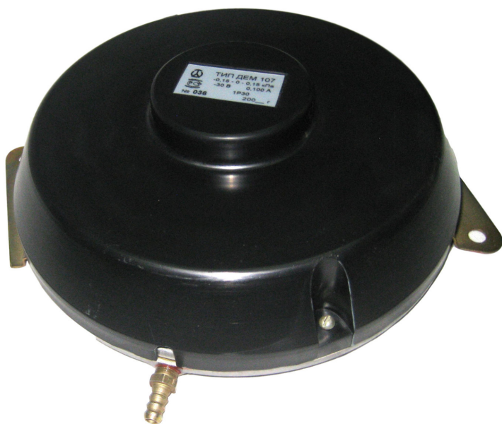
Датчик-реле напора и тяги ДЕМ-107

Алматы (7273)495-231 Ангарск (3955)60-70-56 Архангельск (8182)63-90-72 Астрахань (8512)99-46-04 Барнаул (3852)73-04-60 Белгород (4722)40-23-64 Благовещенск (4162)22-76-07 Брянск (4832)59-03-52 Владивосток (423)249-28-31 Владикавказ (8672)28-90-48 Владимир (4922)49-43-18 Волгоград (844)278-03-48 Вологда (8172)26-41-59 Воронеж (473)204-51-73 Екатеринбург (343)384-55-89